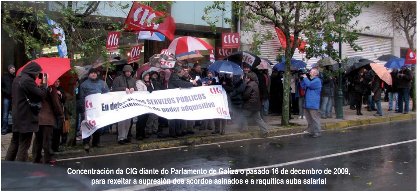
Concentración da CIG diante do Parlamento de Galiza o pasado 16 de decembro de 2009, para rexeitar a supresión dos acordos asinados e a raquílica suba salarial

acordo de Madrid sen ningún tipo de mellora e indo moito máis alá, ao suspender os acordos retributivos sectoriais que estaban negociados e a súa aplicación comprometida para o ano 2010. Sen lugar a dúbidas, o dereito á negociación colectiva dos empregados/as públicos/as non só segue a ser unha materia pendente, senón que a Xunta do PP, mesmamente, se permite desfacer o acordado.