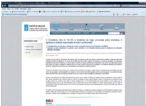
Web da Consellaría