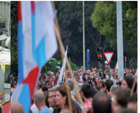
Concentración diante da Xunta