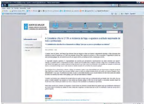
Web da Consellaría