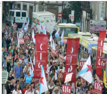
Manifestación polas rúas de Santiago