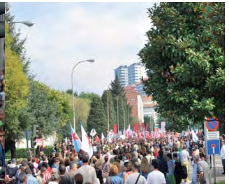
Concentración diante da Xunta