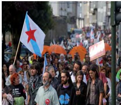
Manifestación polas rúas de Santiago